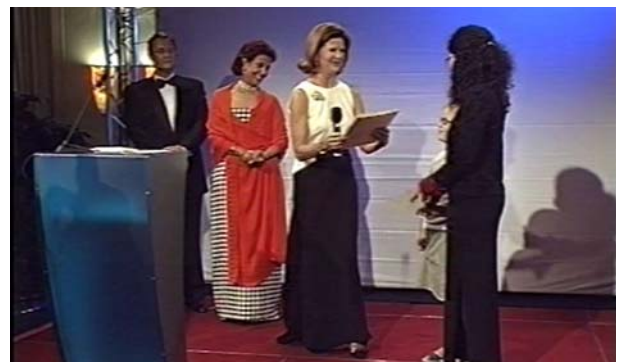
Preisverleihung von Königin Silvia von Schweden an Voilà (2001).

Am 6. und 7. Oktober fand in Jekaterinburg (Russland) ein vom Europarat bzw. der Pompidou-Gruppe organisierter europäischer Suchtpräventionskongress zum Thema „Polydrug Use: New Trends in Youth Culture?“ statt. Im Rahmen dieses Kongresses ist Voilà mit dem europäischen Suchtpräventionspreis ausgezeichnet worden, der in diesem Jahr erstmals verliehen wurde. Der Preise nicht genug, erhielt Voilà Ende des Jahres zusätzlich den Aeberhardt-Preis der Eduard Aeberhardt-Stiftung, mit dem Projekte ausgezeichnet werden, die etwas Herausragendes für die Förderung der Gesundheit in der Schweiz geleistet haben. Voilà teilt sich den Preis mit www.tschau.ch , der Informations- und Auskunftsstelle zu allen Themen, die Jugendliche beschäftigen. Voilà hat bereits im Jahr 2001 von Königin Silvia von Schweden in der Funktion als Präsidentin der Mentor Foundation den Preis für das innovativste Präventionsprojekt der Schweiz erhalten. Diese Preise „gehören“ selbstverständlich teilweise auch der oase.