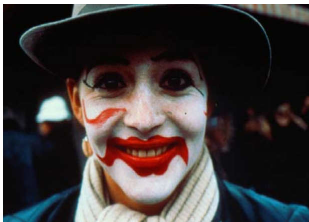
Bilder vom oase-Ausbildungsweekend 04