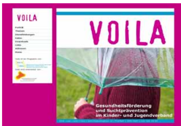
Die Titelseite der neuen Voilà-Homepage

Man kann kaum von Stillstehen reden, wenn die Leistungen von Voilà des Jahres 2006 betrachtet werden – bei Voilà hat sich nämlich auch in diesem Jahr Einiges bewegt und verändert: